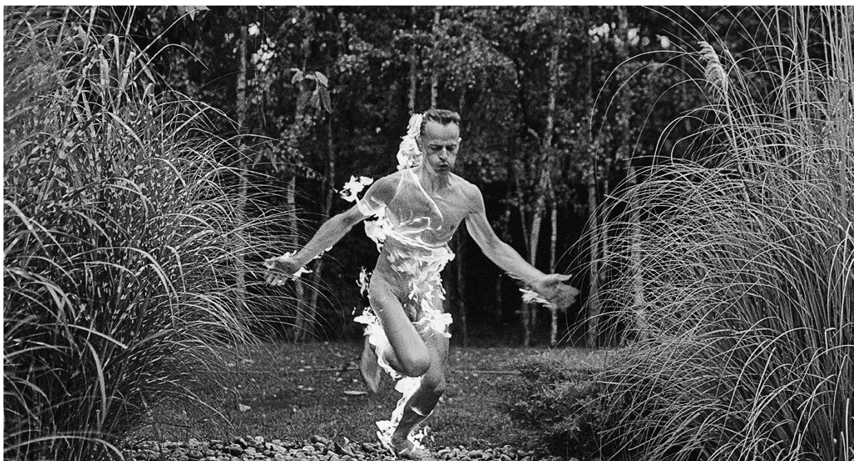
«Autoportrait à l'essence C» © Arnaud Baumann - 1983